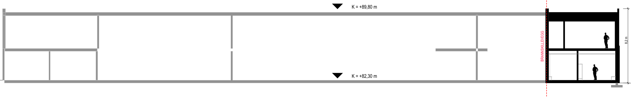
1:200 SNITT B1

Tilbygg: bruker eksisterende konstruksjon, som står på egne fundamenter